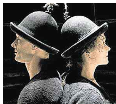
Le P'tit Cirk et son spectacle « 2 » pendant deux jours à Bruz.

Vendredi 5 et samedi 6 février, à Bruz, respectivement à 18 h 30 et 20 h 30, et le lendemain à 16 h et