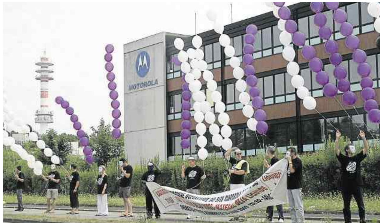
Fin juin, à l'occasion de la fermeture de l'entreprise, une cinquantaine d'ex-salariés avaient procédé à un lâcher de ballons symbolique.

La direction ne souhaite pas commenter la décision judiciaire. Elle