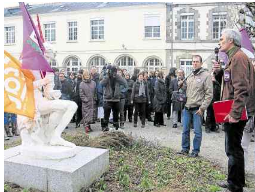
200 à 300 salariés ont manifesté hier après-midi dans la cour d'honneur de l'hôpital psychiatrique.